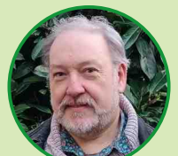
Rival Raude Membre